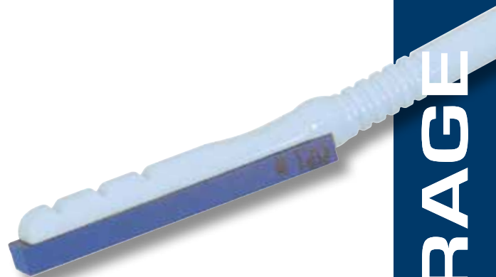
Retouche de glissière de machine